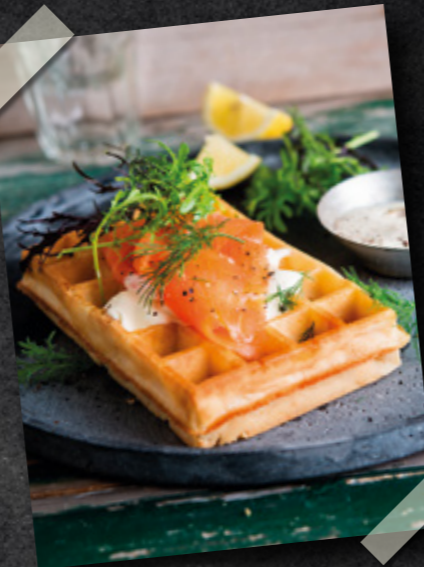
Platos salados Pratos salgados