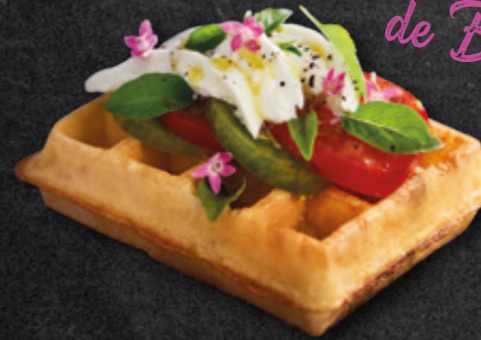
Mini gaufres de Bruxelas