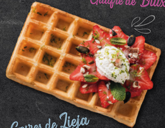
Gofres de Lieja Gaufres de Liège