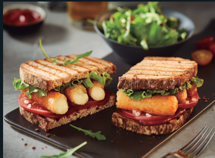
EN BURGHER / BOCADILLO