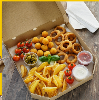
Menu 1 Fun Box

Informujte se o nových produktech a akcích, povzbudte zákazníky, aby se podělili o své zkušenosti.