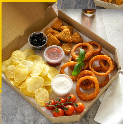
Menu 2 Party Box