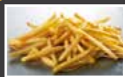
SureCrisp 6x6 CON PIEL/SIN PIEL

Patatas (89,5%), rebozado* (5,1%), aceite de girasol (5%), sal (0,4%)