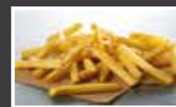
SureCrisp 9x9 CON PIEL/SIN PIEL

Patatas (89,5%), rebozado* (5,1%), aceite de girasol (5%), sal (0,4%)