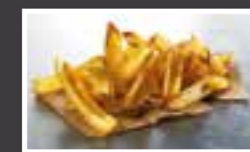
SureCrisp FRY'N DIP CON PIEL

Patatas (90%), aceite de girasol (5%), rebozado* (4,6%), sal (0,4%)