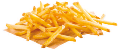
SURECRISP™ 6/6 CON PIEL