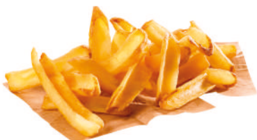
SURECRISP™ FRY'N DIP CON PIEL