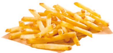
SURECRISP™ 9/9 CON PIEL