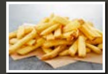
SureCrisp HOMESTYLE SKIN ON

Kartoffeln (89 %), Sonnenblumenöl (5,5 %), Ummantelung* (5 %), Salz (0,4 %)