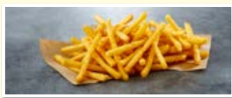
SureCrisp MAX 7/7