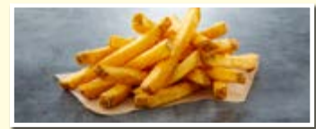
SureCrisp MAX 14/14 Skin On

Kartoffeln (87,6 %), Ummantelung (7,4 %: modifizierte Stärke, Reismehl, Dextrin, Reisstärke, Kurkumapulver, Verdickungsmittel: Xanthan; Farbstoff: Paprikaextrakt), Sonnenblumenöl (4,3 %), Salz.