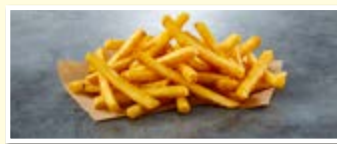
SureCrisp MAX 10/10

Kartoffeln (83,5 %), Ummantelung (10,3 %: modifizierte Stärke, Reismehl, Dextrin, Reisstärke, Kurkumapulver, Verdickungsmittel: Xanthan; Farbstoff: Paprikaextrakt), Sonnenblumenöl (5,5 %), Salz.