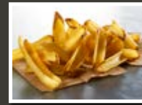
SureCrisp FRY'N DIP SKIN ON

Kartoffeln (90 %), Sonnenblumenöl (5 %), Ummantelung* (4,5 %), Salz (0,5 %)