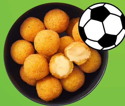
Športový deň Cheese Balls počas futbalového zápasu