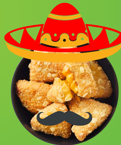
Mimoriadne obľúbené produkty Nacho Cheese Triangles ako časovo obmedzená ponuka