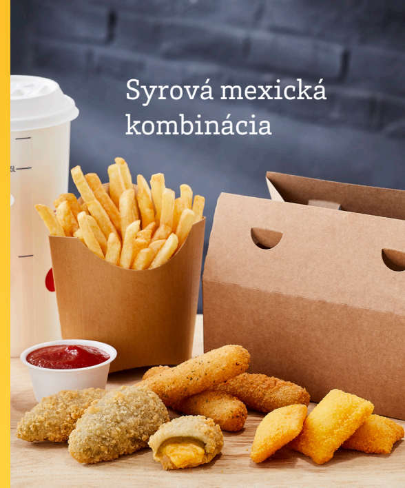
Syrová mexická kombinácia

3× porcia chuťoviek + 1 porcia hranolčiekov + 2× 50 ml nápoje za x €