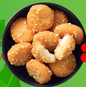
Čas Vianoc Camembert Bites v slávnostnom období