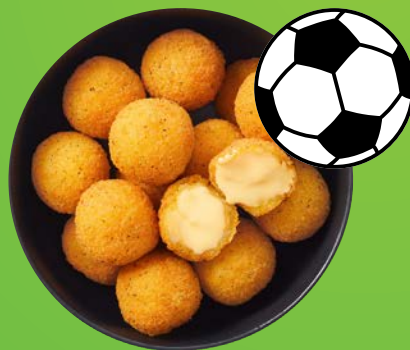
Ημέρα μπάλας Cheese balls κατά την διάρκεια της ποδοσφαιρικής σεζόν