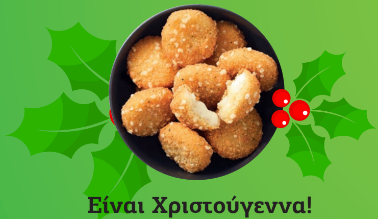
Είναι Χριστούγεννα! Camembert Bites για την εορταστική περίοδο