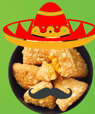
Ethnic βραδιές Nacho Cheese Triangles μόνο για περιορισμένο χρόνο